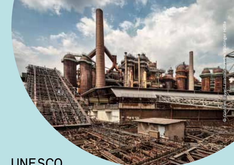
© Gerd Pieper, Bayer/LAWaldkulturerbe Völklinger Hütte