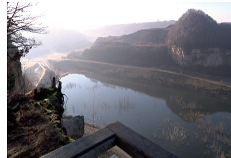
Blick von der Aussichtsplattform der ehemaligen Sandgrube in Merlebach.

Direkt in der Nähe befindet sich eine Aussichtsplattform, die vor einigen Jahren von der Regionalverwaltung Frankreich errichtet wurde.