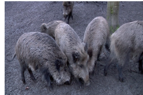
Wildschweine im Wildpark Karlsbrunn.

Tierisch wild beginnt unsere Wanderung im Wildpark von Karlsbrunn. Zwar ist der Eintritt kostenlos, aber keineswegs umsonst. Ein Besuch lohnt sich zu jeder Jahreszeit, denn hier gibt es immer etwas Neues zu entdecken. Afrikanische Bergziegen, Schwarzwild, Dam- und Sikawild zeigen sich hier in ihrer natürlichen Umgebung. Der Verkaufskiosk versorgt nicht nur die Besucher mit Speisen und Getränken, sondern bietet auch Tierfutter zur Fütterung an, damit Besucher die Wildtiere mal nah betrachten können.