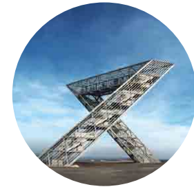
Saarpolygon Ens Dorf