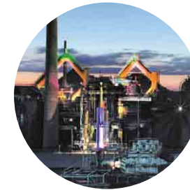
Weltkulturerbe Völklinger Hütte