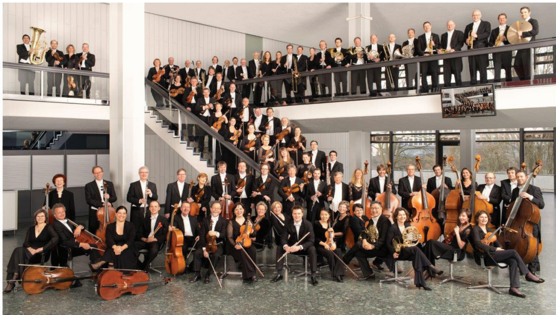
Deutsche Radio Philharmonie Saarbrücken Kaiserslautern