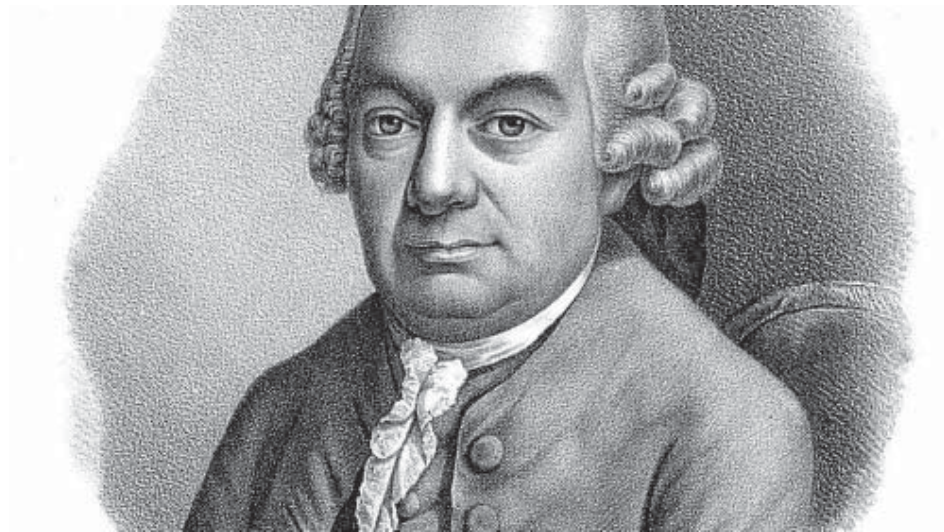
Carl Philipp Emanuel Bach